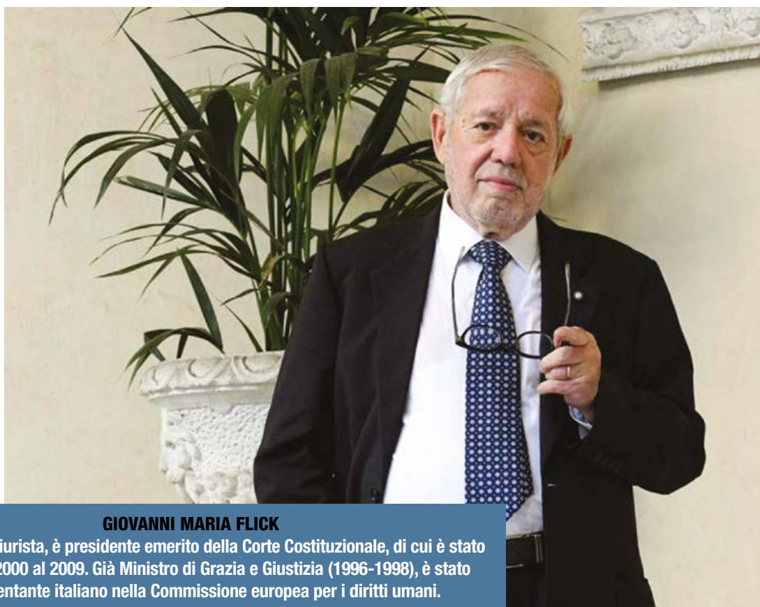
GIOVANNI MARIA FLICK

Giovanni Maria Flick Presidente emerito della Corte Costituzionale